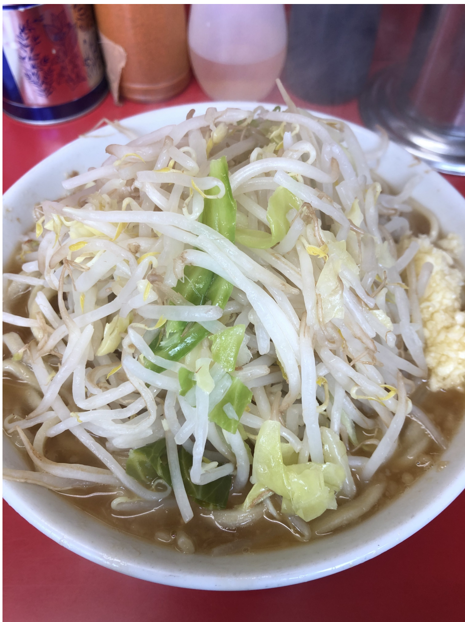
Fig.3 無理しても仕方ないので美味しいもの食べにいきます。

本当に何もしたくない日も当然ありますので、その時はこのようなスケジュールになります。研究のことを一切考えず、いっぱい寝て全力で遊ぶのがミソです(オススメは金曜日、3連休にできるので)。無理に研究してもモチベーションが下がるだけなので、休養日と割り切ってしまった方が次の日以降頑張れるような気がします。